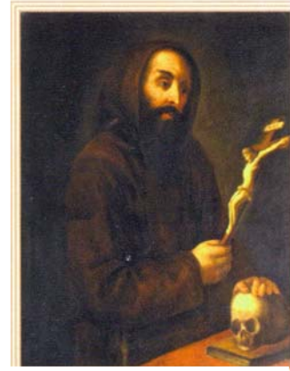
Padre Matteo de Bascio

Nakon javnog priznanja od Crkve na vrata kapucinskih samotišta sve češće su sada dolazila i kucala ponajbolja braća iz opservancije, ona koja će kasnije postati temeljni stupovi nove franjevačke zajednice: bili su to Bernardin iz Astia, Franjo iz Jesia, Ivan iz Fana te Bernardin Ochino iz Siena, Euzebije iz Ancone i mnogi drugi.