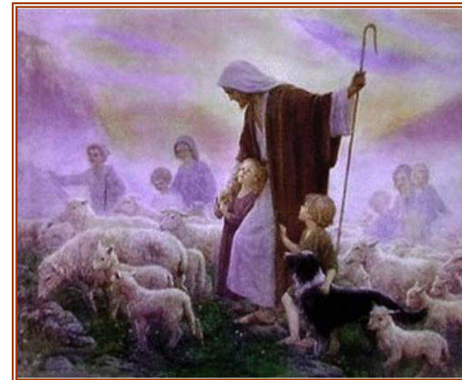
EVANĐELJE – Iv. 10, 27-30

U ono vrijeme: Reče Isus: " Ovce moje slušaju glas moj; ja ih poznajem, i one idu za mnom. Ja im dajem život vječni te neće propasti nikada i nitko ih neće ugrabiti iz moje ruke. Otac moj, koji mi ih dade, veći je od svih i nitko ih ne može ugrabiti iz ruke Očeve. Ja i Otac jedno smo."