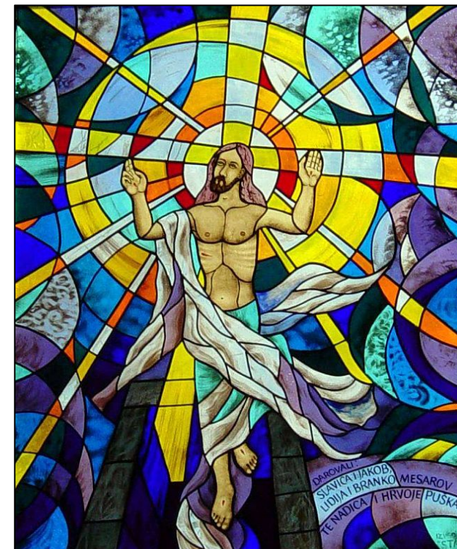
Vitraj: Kristovo uskrsnuće - rad akadem. slikara Marijana Jakubina

Dragi vjernici, neka vas sve obasja uskrsno svjetlo i ispuni uskrsna radost koja je stubokom primijenila život apostolima i svima koji su povjerovali da je Isus doista uskrsnuo. Radosne vazmene blagdane žele vam braća kapucini i sestre "Služavke malog Isusa" iz Rijeke.